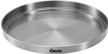
Warmhaltedeckel für Tassen ( nicht im Lieferumfang enthalten) geeignet für ca. 10 – 15 Tassen Art.-Nr.: 200059